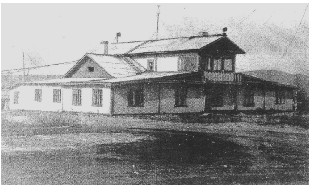
Здание КДП, Мурмаши, служило до 1983 года. В этом здании размещались основные службы, связанные с выполнением полетов.

На Кольский полуостров реактивные самолеты стали летать с открытием в 1963 году аэродрома совместного базирования Килп-Явр. Начали принимать самолеты Ту-124, Ил-18, затем Ан-24, Ту-134.